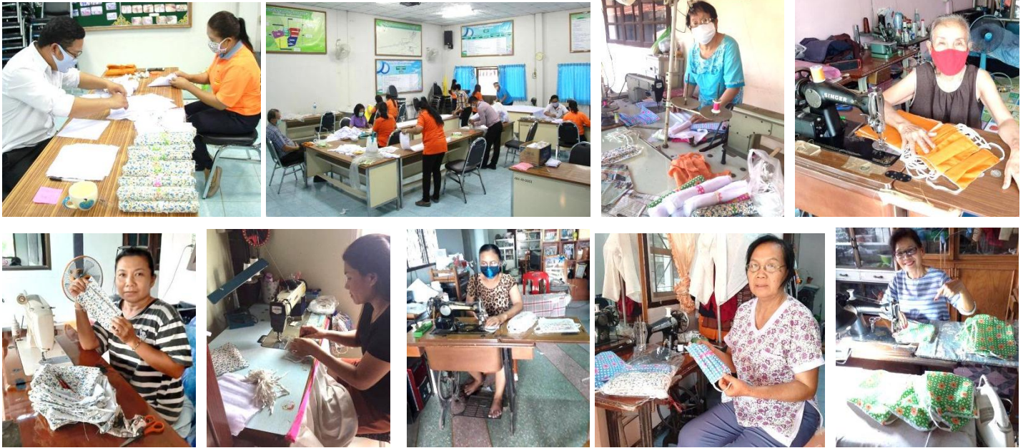
วันที่ ๑๘ มีนาคม ๒๕๖๓ ล้างตลาดสดเทศบาลตำบลลาดแค

เทศบาลตำบลลาดแค ได้ดำเนินการล้างตลาดสดเทศบาลและแผงขายสินค้า เพื่อการป้องกันและควบคุมการแพร่ระบาดของโรคติดเชื้อไวรัสโคโรนา (COVID-19)