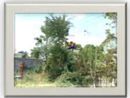
ซ่อมแซม , ปรับปรุง ระบบไฟฟ้าส่องสว่างภายในเขตเทศบาลตำบลลาดแค