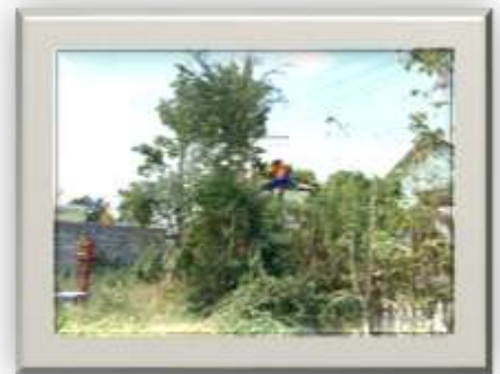
ซ่อมแซม , ปรับปรุง ระบบไฟฟ้าส่องสว่างภายในเขตเทศบาลตำบลลาดแค